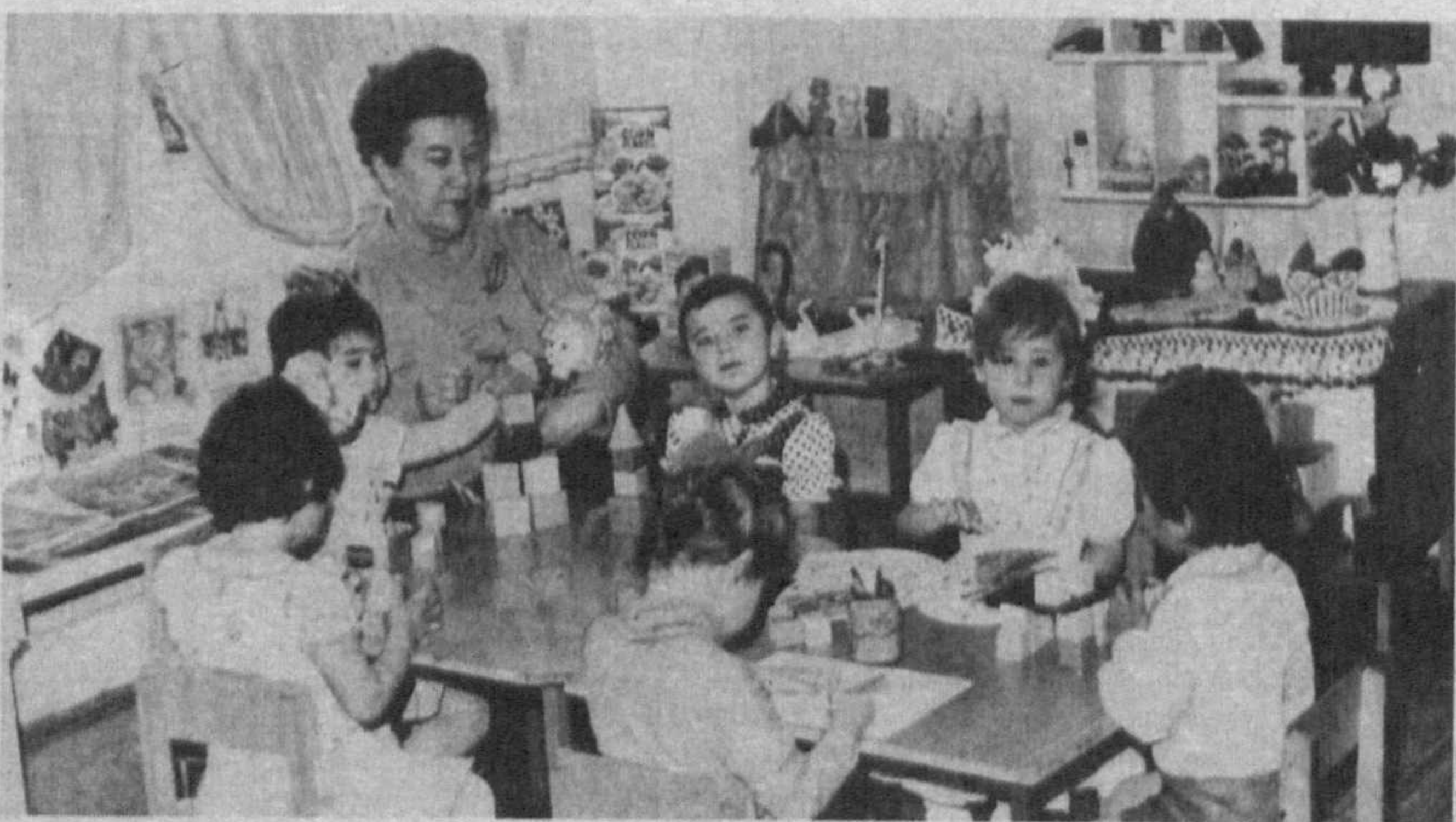
Идут занятия в каршинском городском детском саду "Подира".