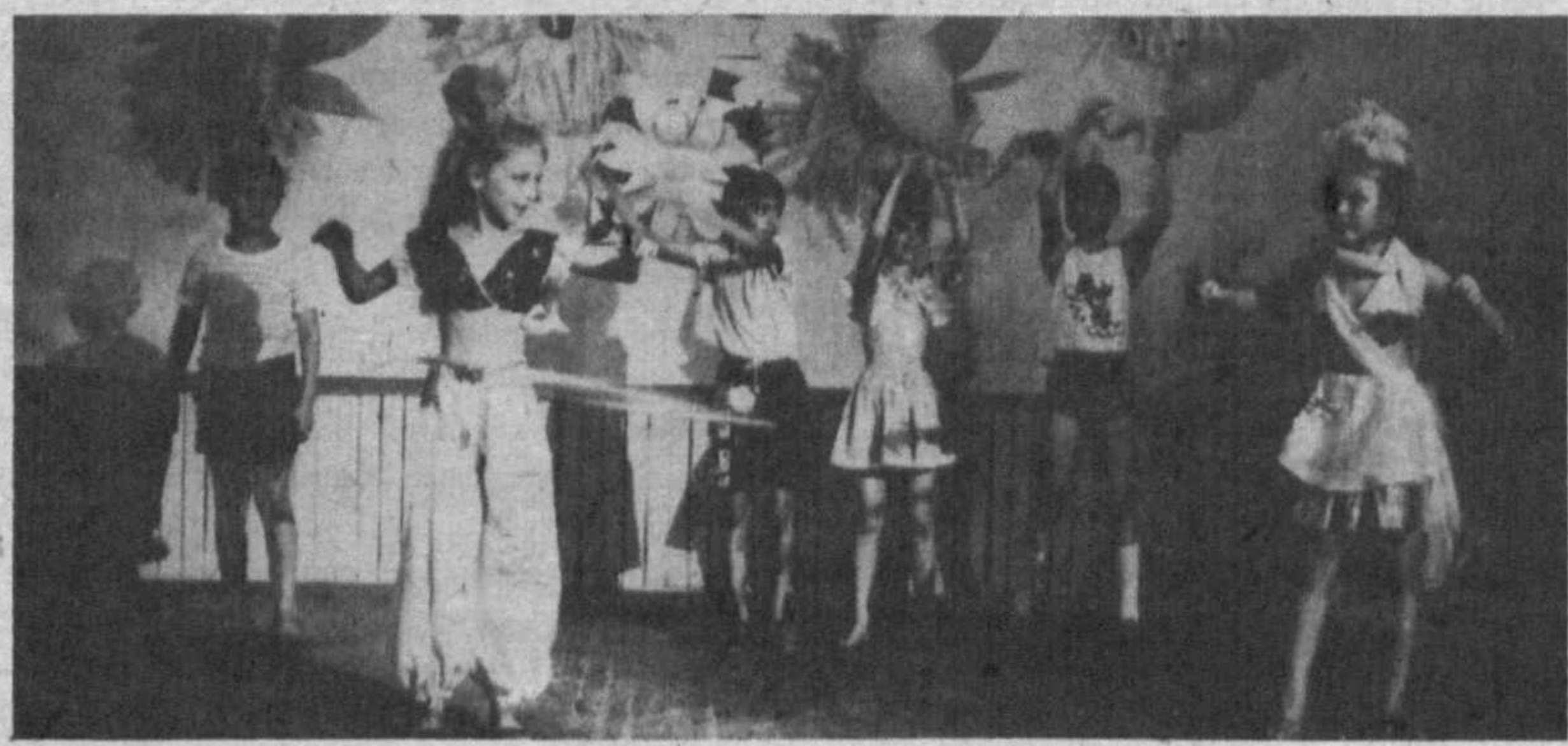
Каникулы. Дети. Лето

По просьбе автора гонорар за материал перечислен в фонд редакции газеты "Учитель Узбекистана".