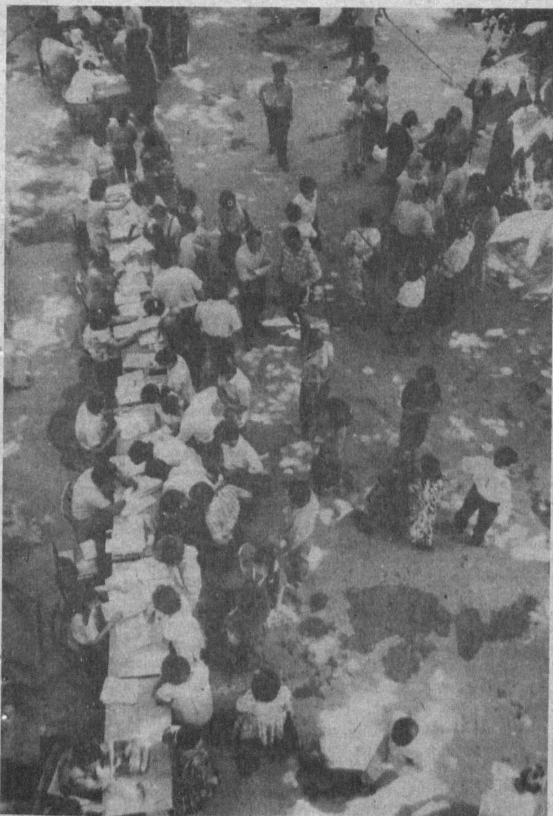
Абитуриенты — в большинстве своем вчерашние школьники — переступили пороги вузов. Выбор сделан, документы сданы, впереди — приемные экзамены... Успехов вам, абитуриенты! На снимках: идет прием документов в Ташкентский госпединститут им. Низами.