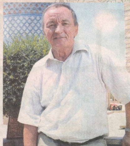
Остонамдан оёқ уздинг, қароқўз, Денгизларга дарёлар келмай қўйди.

Менмасмидим энг муҳтож, энг керагинг, Кимга айтиб, кимдан сўрай дарзинг. Келмай қўйди юрагимга юрагинг, Дунёларга дунёлар келмай қўйди.