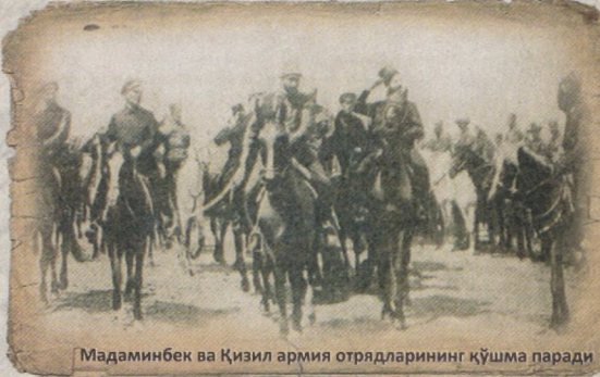
Мадаминбек ва Қизил армия отрядларининг қўшма пароди