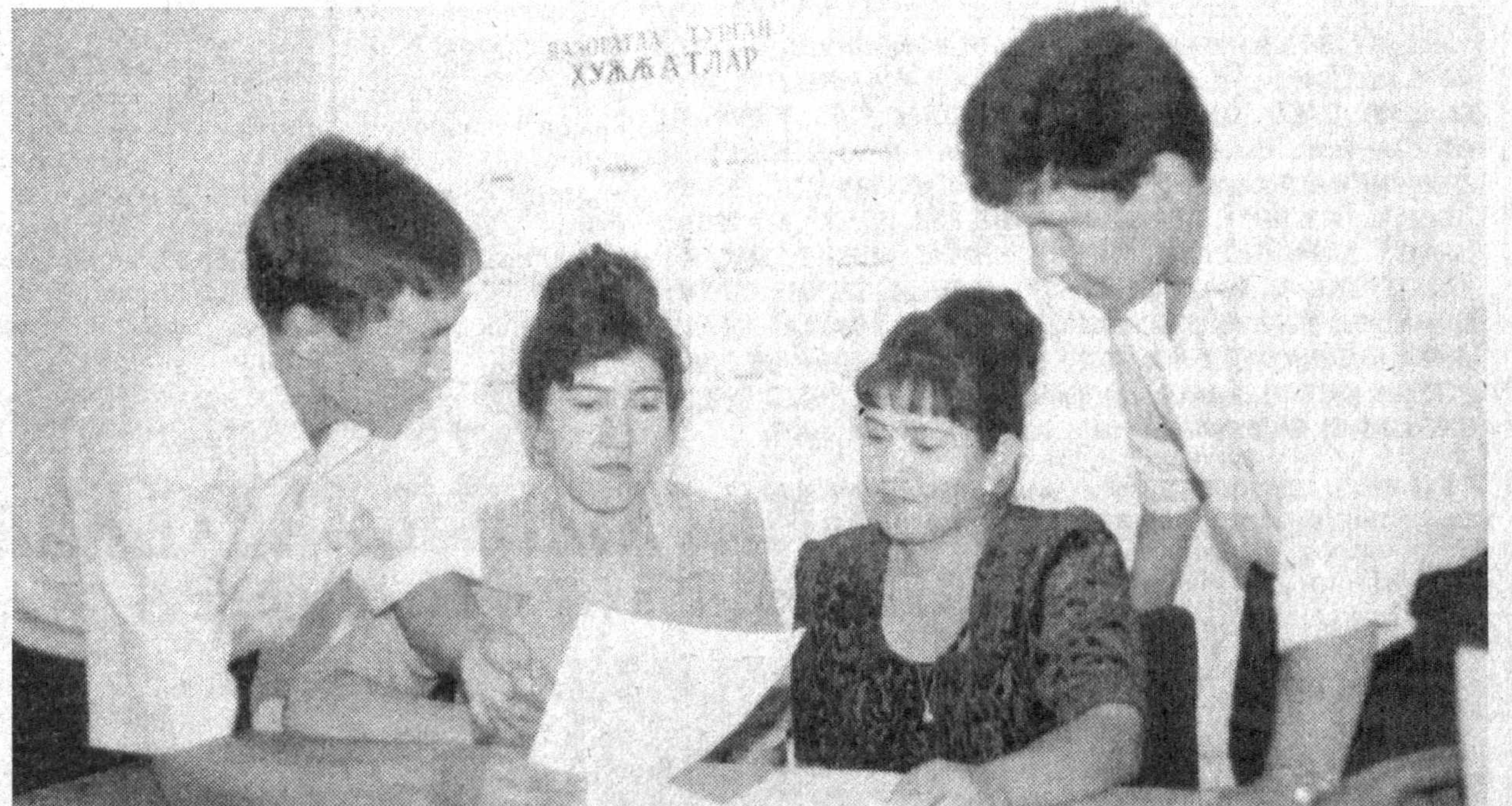
Касаба уюшмалари меҳнаткашлар ижтимоий-иқтисодий, ҳуқуқий манфаатларининг устувор ҳимоячиси ҳисобланади. Бу борада Сурхондарё вилояти касаба уюшма Кенгаши, тармоқ кўмиталари мутахассислари томонидан