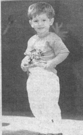
Они — наше будущее.