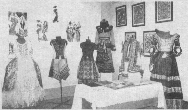
Выставочные товары «Ташаббус-2004».