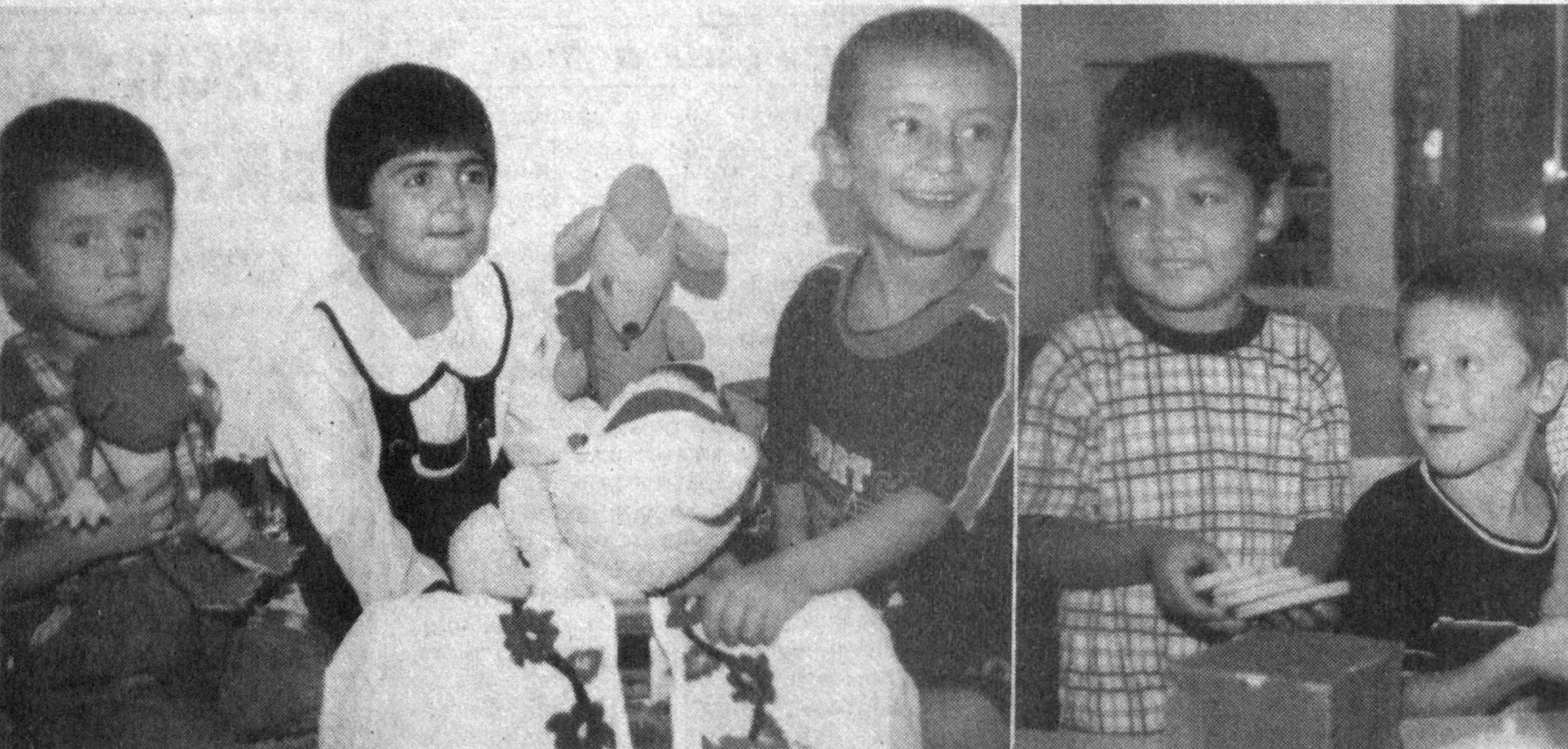
Барча яхши нарса болаларга! Сарои-сиё туманидаги халқ таълими бўлимига қарашли «Қалдиғоч» болалар боғчаси-нинг тарбияланувчилари бу ширини амалдаги исботини қалбдан хис қилмоқ-далар. Мазкур болалар боғчасида тар-бияланаётган 140 нафар кичкинтой учун барча шароитлар муҳайё этилган.

мизнинг Президент ҳузури-даги давлат ва жамият қури-лиши академиясининг тарих маркази, Ўзбекистон фан-лар академиясининг архео-логия институти ва Шахри-сабздаги Амир Темури но-ли моддий-маданият тари-хи биргаликда Европа ҳам-жамиятининг «ИПТАС» бўли-мига Темури номидаги лойи-хани тақдим этди.