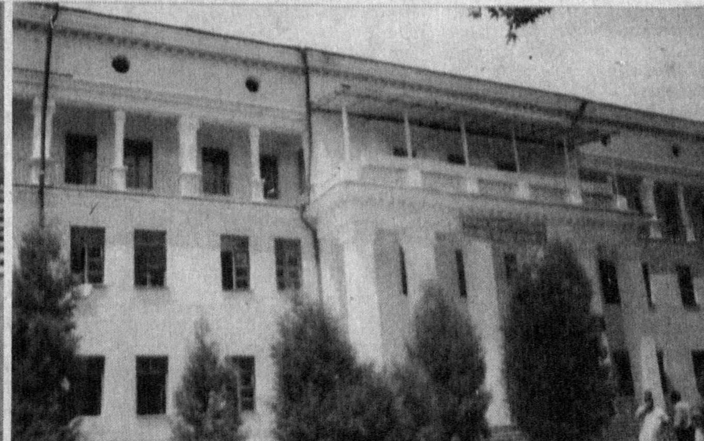
Чирчиқ шаҳар Шошилин тиббий ёрдам марказида (суратда) аҳоли саломатлигини муҳофаза қилиш бўйича қатор ижобий ишлар амалга оширилмоқда. Марказ ўттиз ўринли беморларни ётқизиш даволашга мўлжалланган. Шунинг-