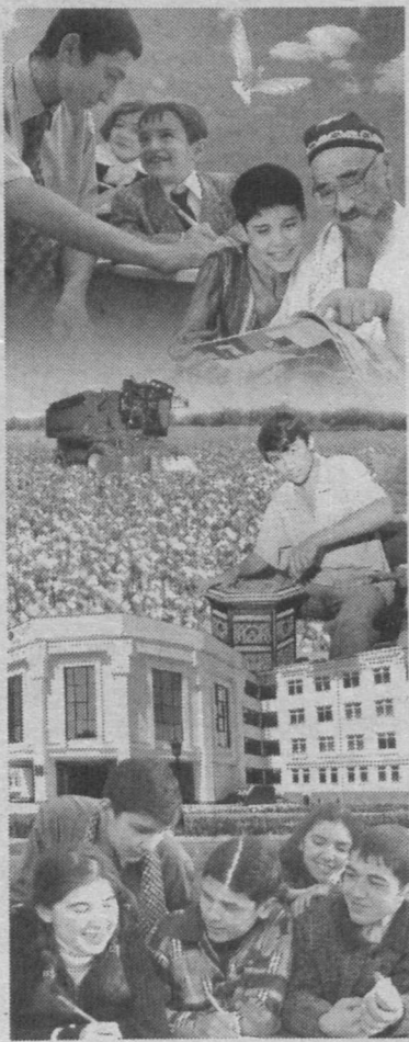
(Окончание. Начало на 3-й стр.)

25 февраля 2003 года состоялся городской конкурс «Ораторское искусство», в проведении которого отделением «Камолот» г. Ташкента помог столичный центр «Маънавият ва маърифат».