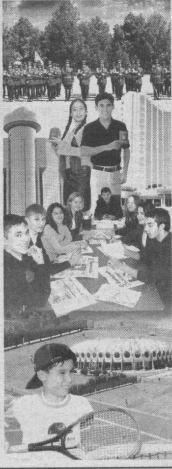
(Окончание. Начало на 3-й стр.)

Ташкентское городское отделение «Камолот» выступило инициатором множества грандиозных мероприятий, которые широко освещались средствами массовой информации.