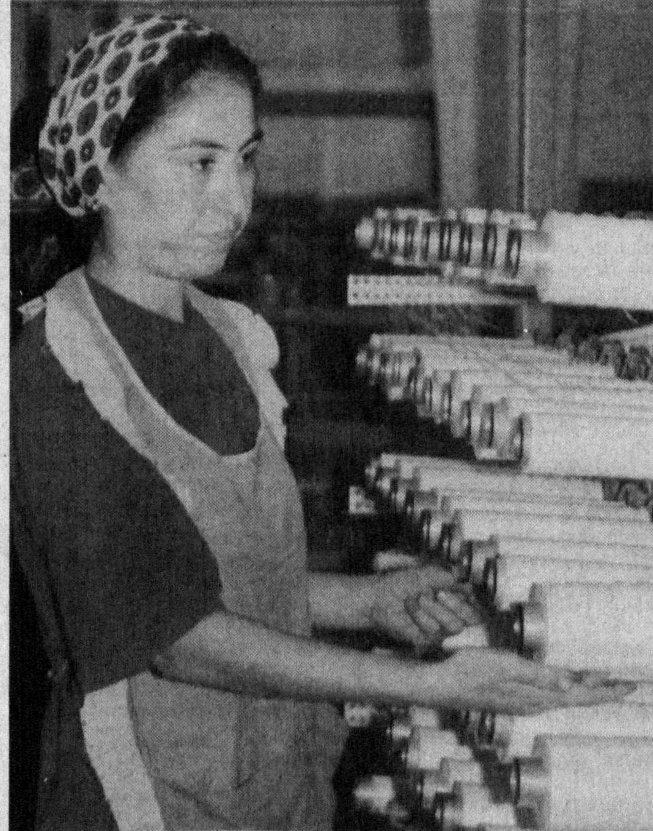
Янгийўл шаҳридаги Ўзбек-Хитой «Тарим импорт-экспорт» қўшма корхонасида айни кунларда асосан ёшлар меҳнат қилмоқда. Жамоа ишчиларига барча қулайликлар яратилган. Мазкур корхонада йилга 31 миң тоннадан зиёд халқ ҳўжалиги тармоқлари учун кўп ишлаб чиқарилмоқда.

Суратларда: корхона ҳаётидан лавалар.