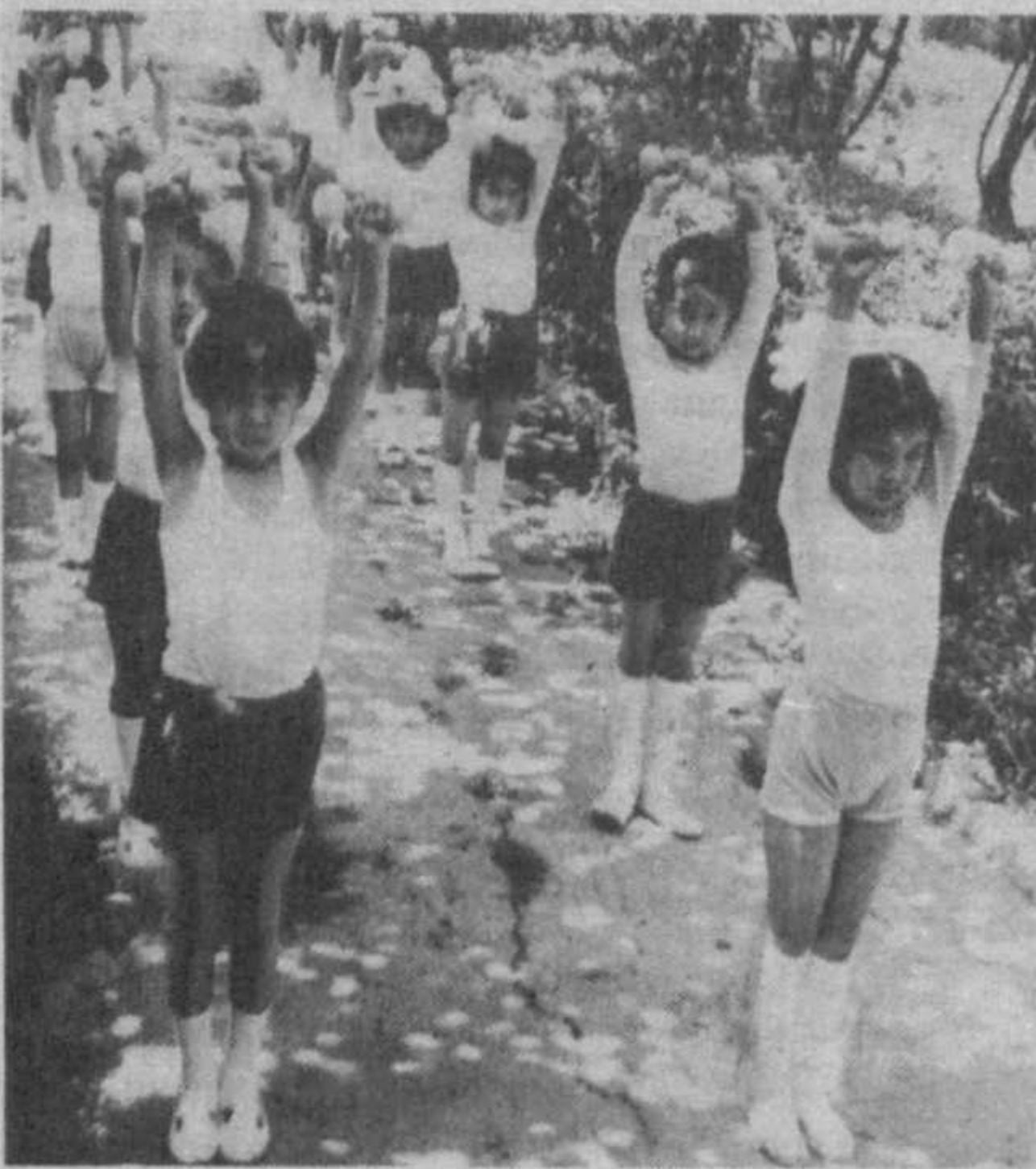
Так начинается утро в детском саду №468 Шайхантаурского района города Ташкента.