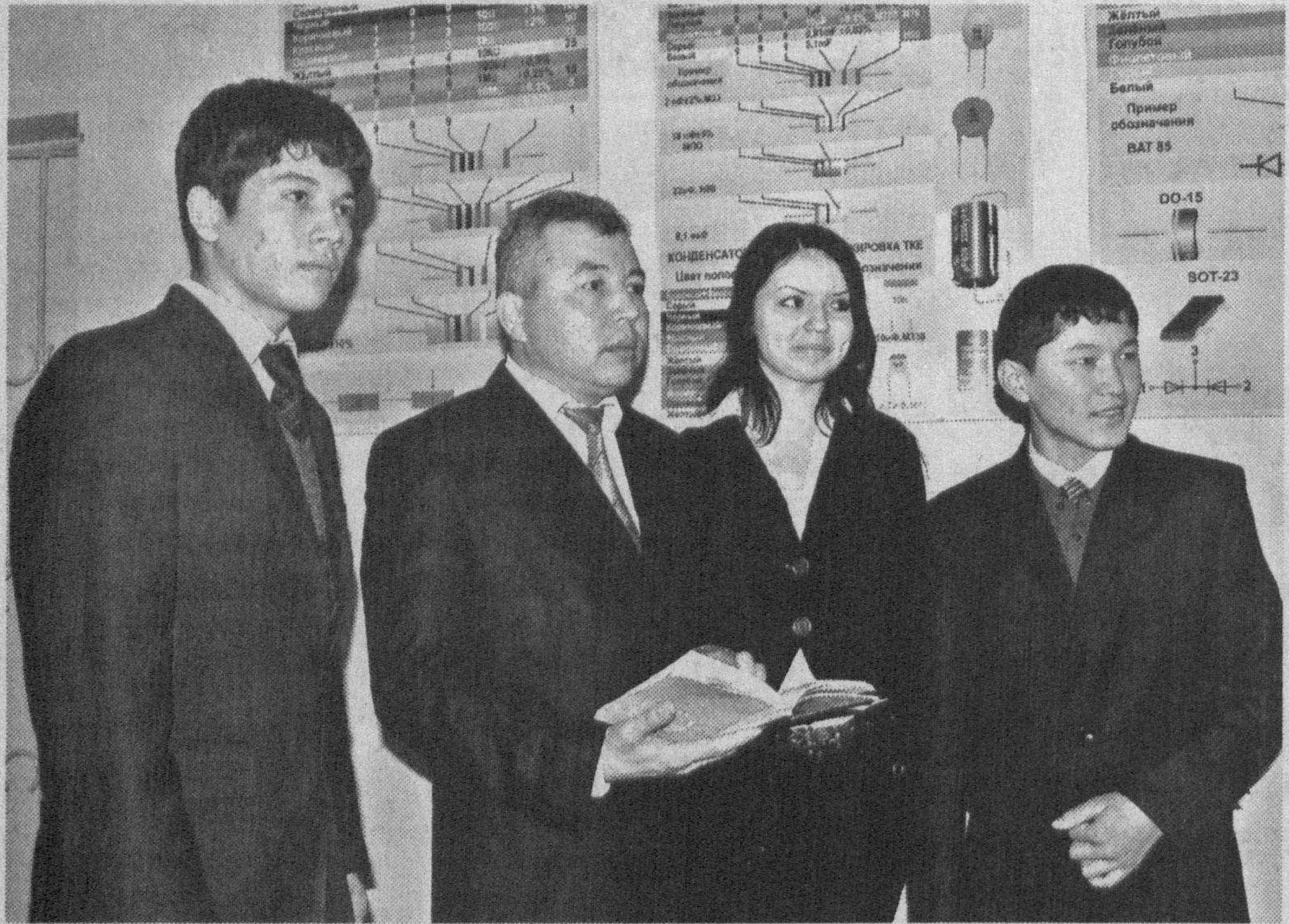
В Год молодежи во всех учебных заведениях активизировалась работа, направленная на повышение уровня образования, более активное участие в акциях ОДМ «Камолот».