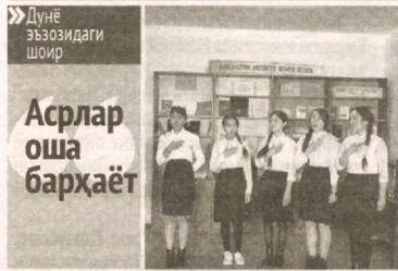
«Дунё Эъзодигади шоир» Асрлар оша барҳаёт