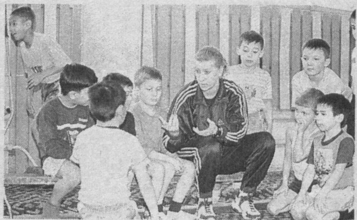
Будущие чемпионы...