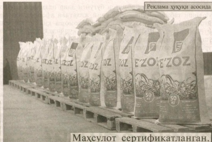
Реклама ҳуқуқи асосида