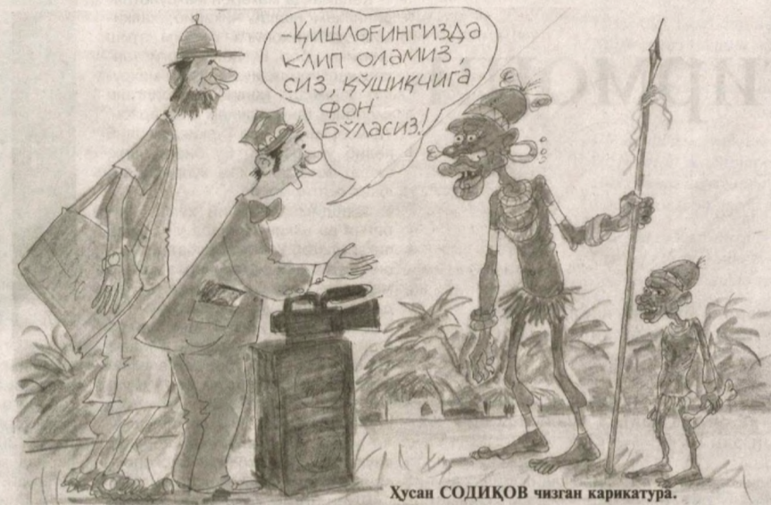
Хусан СОДИҚОВ чизган карикатура.