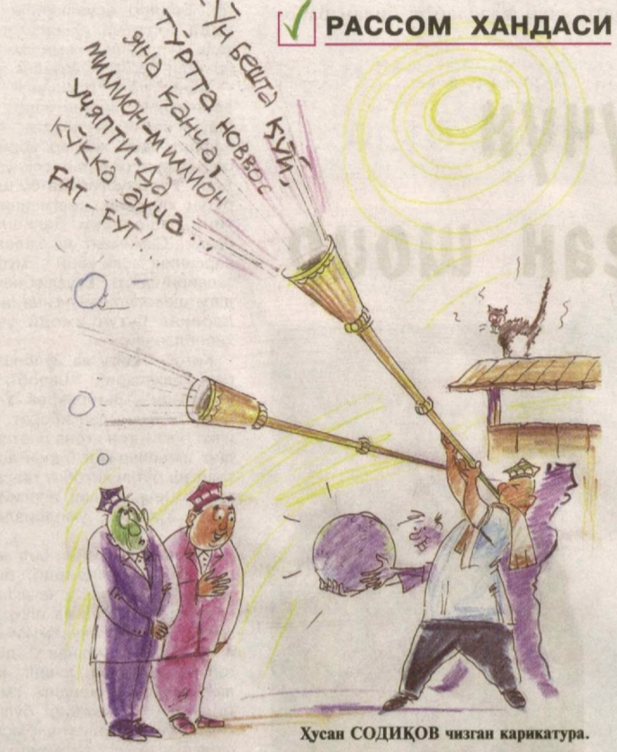
Хусан СОДИҚОВ чизган карикатура.