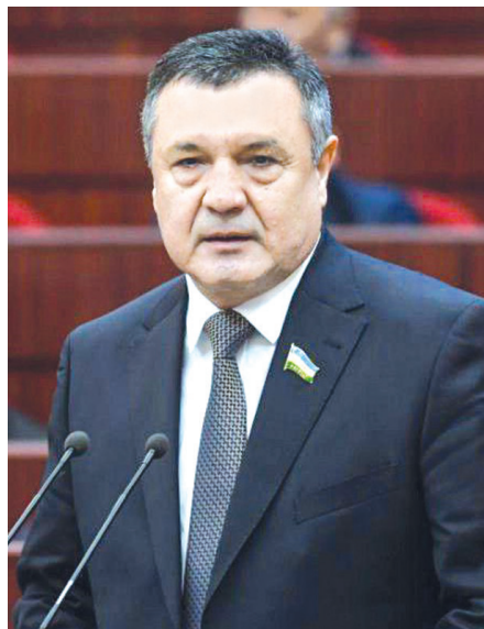
Нурдинжон ИСМОИЛОВ, Олий Мажлис Қонунчилик палатаси Спикери

Ўзбекистон Президенти IX–XII ва XV–XVI асрларда бизнинг ҳудудимизда рўй берган икки Уйғониш даври билан боғлиқ тарихий ютуқлар ҳақида тўхталиб, Ренессанснинг янги босқичини амалга ошириш, Ўзбекистонни дунёдаги етакчи давлатлар қаторига олиб чиқиш, миллатимизнинг маънавий ва интеллектуал салоҳиятини тубдан ривожлантириш учун бой тарихимизни ижодий жиҳатдан қайта англаш заруриятига эътиборимизни қаратди.