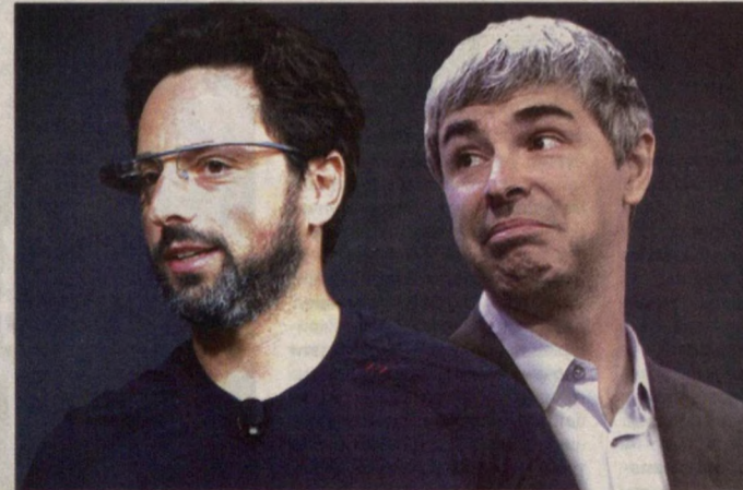
Ларри Пейж ва Сергей Брин "Google"ни яратган шахслар.

Ларри Пейж ва Сергей Брин "Google"ни яратар экан уни дастлаб "BackRub" деб атайдилар, икки йилдан кейингина бу ихтиро "Google" номи олади. "Google"нинг ҳамма қидирув тизимлари бошида 4 гигабайтлик қаттиқ дискларда сақланган.