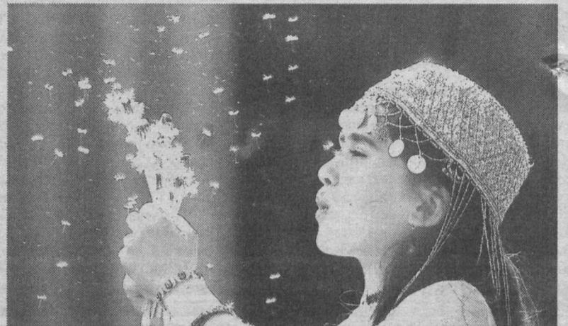
Никто не может остаться равнодушным к весеннему цветению природы — и особенно прекрасная половина человечества.