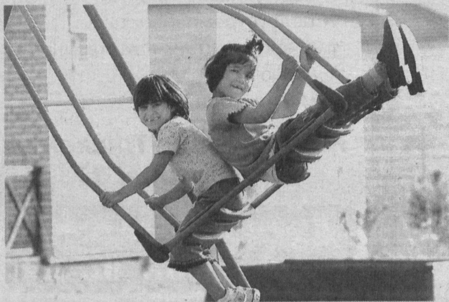
«Крылатые» качели летят, летят...