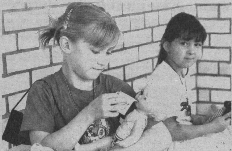
Игры — любимое занятие наших детей.

«Хотелось бы подключиться в плане наших технологий, но пока прозвучало предложение поучаствовать в научном плане», — добавил Перминов.