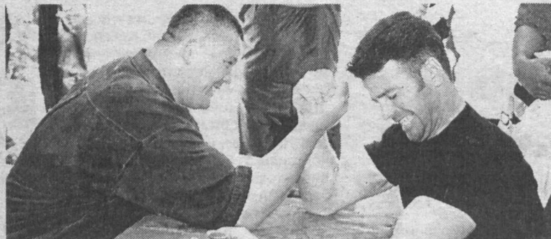
Армрестлинг — спорт для настоящих мужчин.