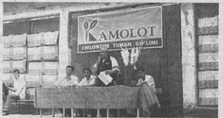
Камолон», II место — «Новза», III место — «Чарх Камолон-3».

В общекомандном зачете соревнований победителями стали: I место — махалля «Чарх