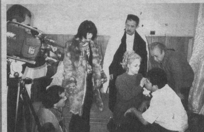
рой стали две враждующие семьи, повестует о вечной борьбе добра со злом, о нравственных проблемах, живущих в душе каждого из