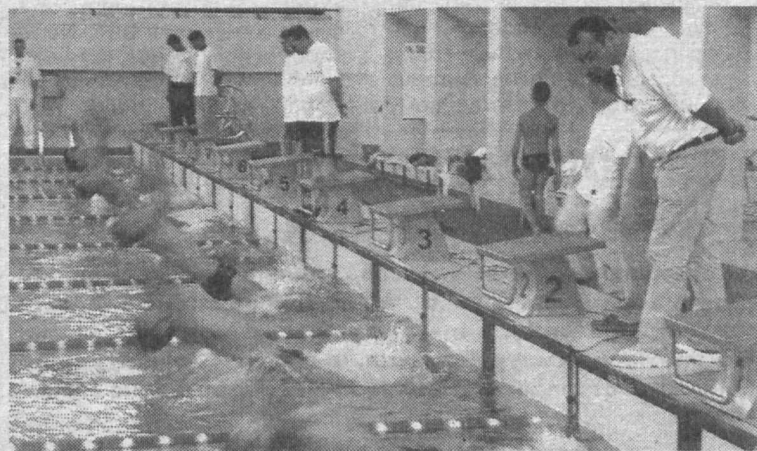
Опять дан старт...