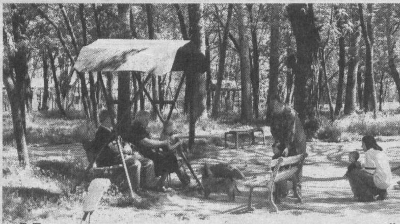
В Ташкенте много зеленых уголков, где можно спокойно отдохнуть и просто прогуляться.

Как ожидается, все работы по проверке и устранению дефекта займут у дилера той или другой компании около 20 минут. По традиции, все работы будут проведены совершенно бесплатно. Отметим также, что в Германии отзыв затронет чуть больше 6000 внедорожников Porsche Cayenne и 12 000 внедорожников VW Touareg. Все остальные отзываемые автомобили были поставлены на экспортные рынки.