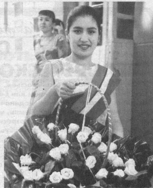
Все победители награждены грамотами и призами.