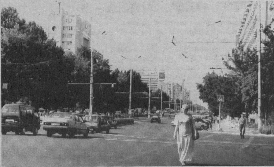
Иду, шагаю по Ташкенту...