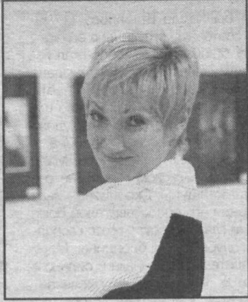
Прекрасное — оно рядом с нами.