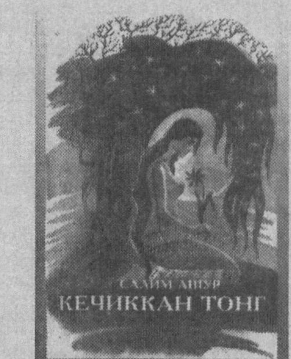
“Янги аср авлоди” нашриёти, 2001.

безакларсиз, ҳавойилиқдан холи, фақат сўзининг моҳият-мазмунига, таъсир кучига таяниб ёзилган шеърлар тўпламда анчагина. Бир шеърда муаллиф ўзини хира чирокка қиёс қилади. Аслида чирокни кўп нарсаларга қиёслаш мумкин.