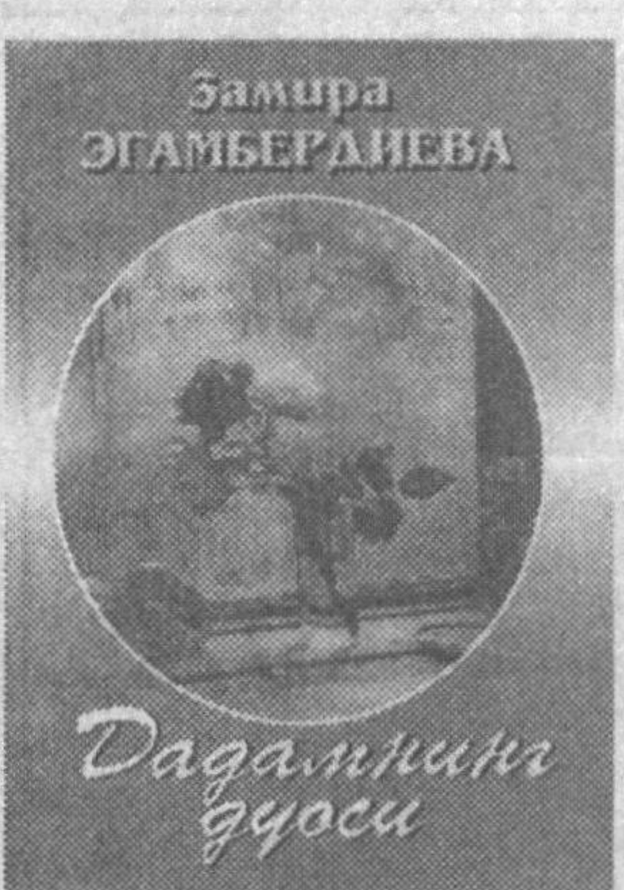
“Шарқ” нашриёт-матбаа акциядорлик компанияси Бош таъририяти, 2002.

мажмуасига бўйсундирилади. Масалан: Эмгир ёғар, шиналаб ёғар, Томчилар, томчилар сочинга, Эмгир ёғар, шиналаб ёғар, Ҳам қайғумга, ҳам қувончига.