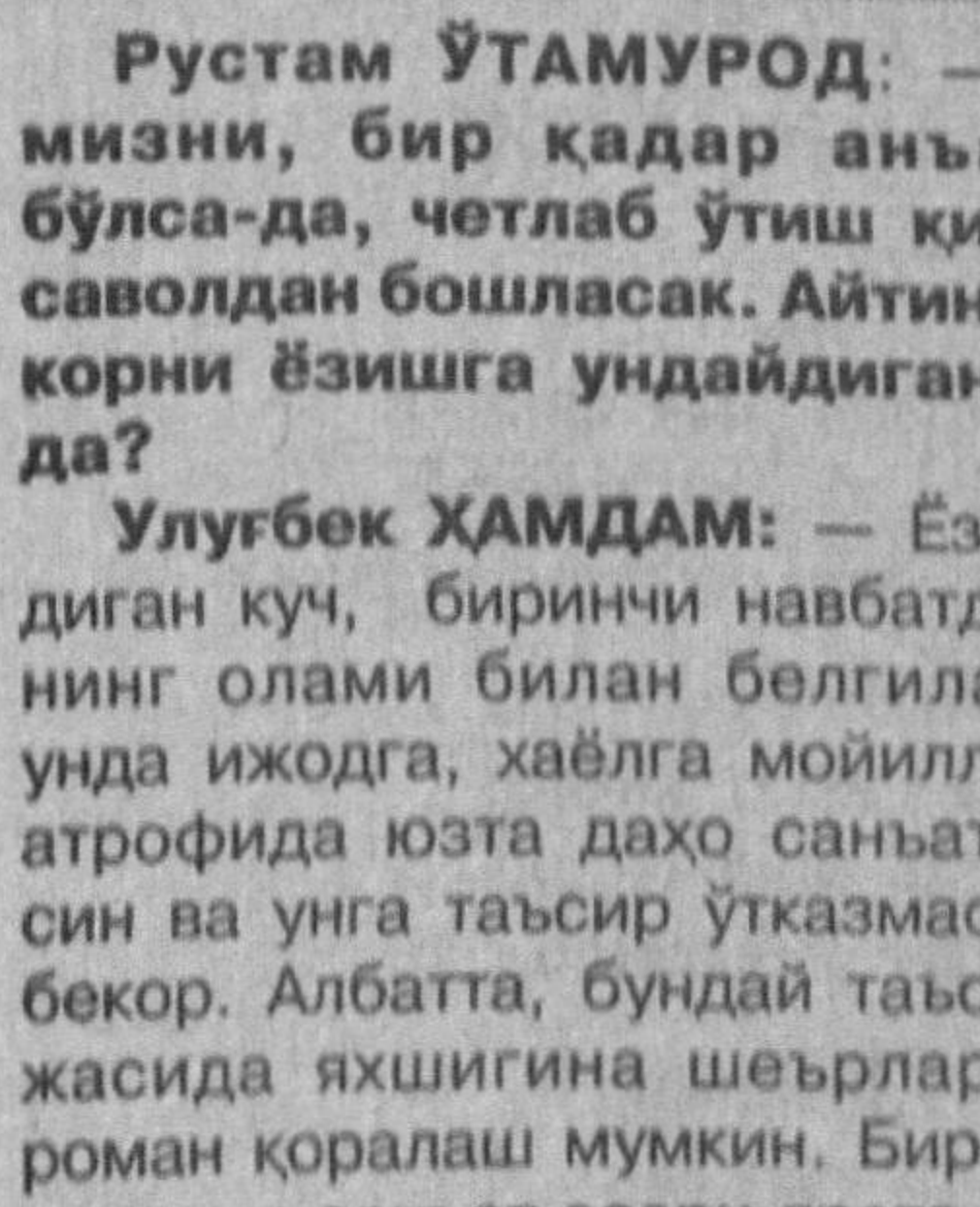
Рустам УТАМУРОД: — Сухбатимизни, бир қадар анъанавийроқ бўлса-да, четлаб ўтиш кийин бўлган саволдан бошласак.

ди. Лекин мўъжиза туйғули висолга етишган қаҳрамонларнинг оддийгина эр-хотун бўлиб ўшагани асло тасаввур этиб бўлмайди. Эҳтимол, шунинг учун ҳам “Ерилтош” ҳеч қачон ёрилмас керак. Акс ҳолда ҳаётнинг (демак, адабиётнинг) кизиги қолмайди.