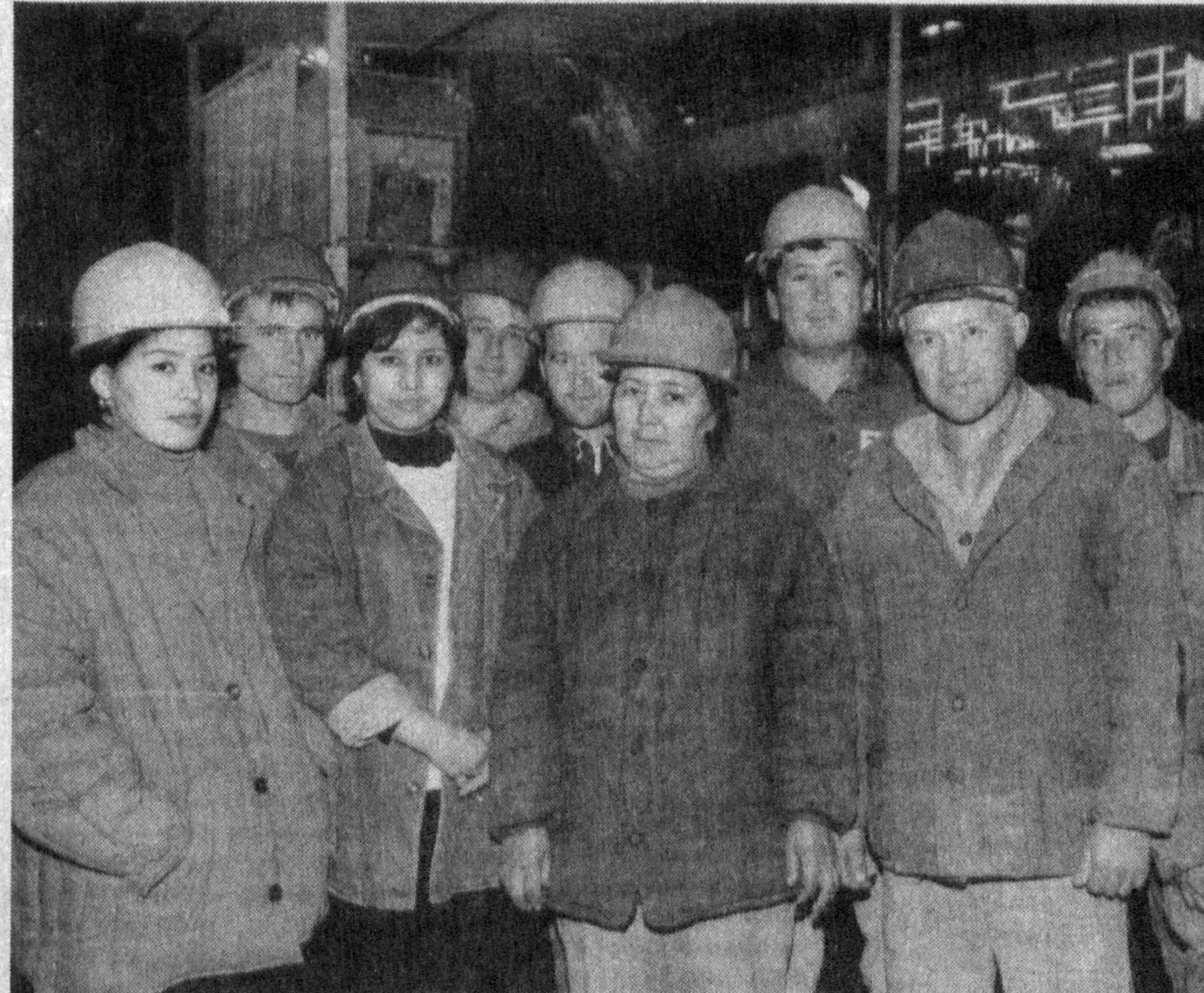
«Охангароншифер» ҳиссадорлик жамиятида ишлаб чиқариш ҳажми ортиб бормоқда. Корхона жамоаси истеъмолчиларга йилнинг ўтган ўн ойи мобайнида 15,5 миллиард сўмликдан ортиқ шифер, асбесткувур ва бошқа хариддорнинг маҳсулотлар етказиб берди. Айни пайтда бу ерда ойига 700 минг дона сифатли шифер, бюртомга қараб