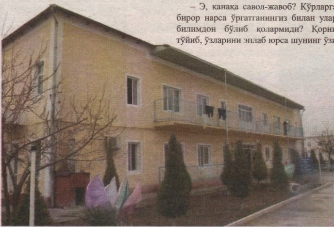
Тахририятдан: Мақолада имконияти чекланган болалар тақдири ҳақида сўз юритилгани сабабли муассаса рақами ва манзили ошкор қилинмади. Тахририят мазкур ҳолат юзасидан тегишли идораларга хат юборди.