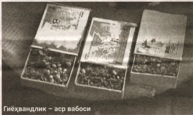
Гиёҳвандлик – аср вабоси

МЧЖ номидан кўрнинг турбидики, жиноий гуруҳ енгил автомобиллар ва енгил моторли транспортларни ижарага ва лизингга бериш билан шуғулланишни режалаштирган. Асли тошкентлик бўлган йигитлар масъулияти чекланган жамиятни 2018 йил 23 апрель кунини Шофиркон тумани давлат хизматлари марказида рўйхатдан ўтказишга эришишди.