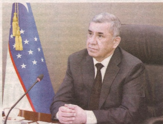
Нигматилла Йўлдошев, Ўзбекистон Республикаси Бош прокурори

Тарих гувоҳ, инсоният ҳаёти фақат яхши кунлардангина иборат эмас. Мамлакатимиз ва халқимиз ҳам ўз бошидан суронли ва таҳликали кунларни кўп ўтказган. Миллатимизнинг биз фахрланиб юрадиган буюклиги ҳам шундаки, у доимо синовли кунлардан ёруғ юз билан ўтган. Ана шундай дамлардаги тобланиш халқимизга енгилмас матонат, сабр ва мислсиз куч-қудрат ато этган.