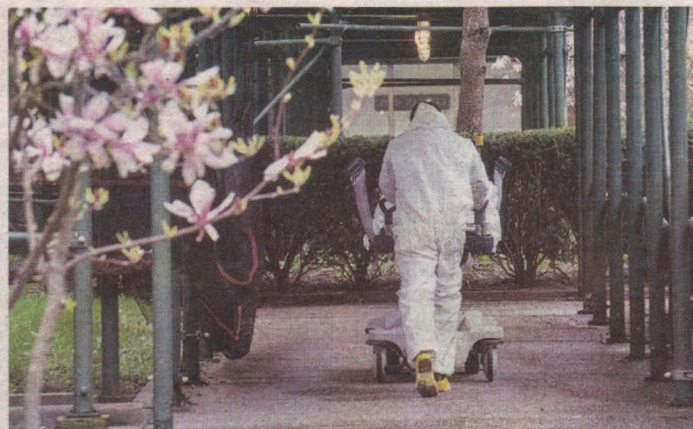
Интернет хабарлари асосида тайёрланди

Жаҳон соғлиқни сақлаш ташкилотининг қайд этишича, айрим тадқиқотлар D витаминини қабул қилиш одамнинг нафас йўлларида кузатиладиган инфекцияларни даволашда самара беради. ЖССТнинг кўшимча қилишича, ушбу витамин етишмовчилиги бутун дунёда мавжуд. D витамини иммуномодулятор ҳисобланади ва тузма иммунитетни кучайтириб, сулак безларидаги химоя қатламларини мустаҳкамлайди. Шу сабабли моддалар етишмовчилиги иммун тизимига таъсир қилиши мумкин.