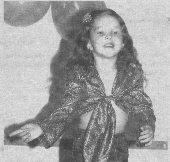
Я радуюсь жизни, Проходим улыбки даря, И, мир познавая, учусь, Любуясь природы твореньем...