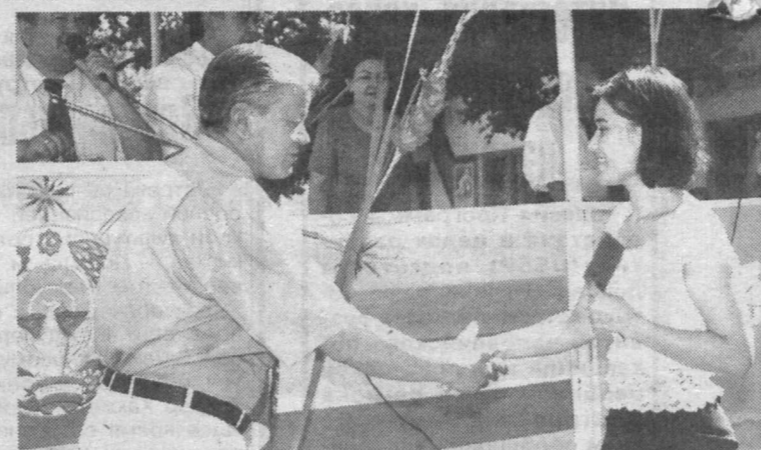
Национальная программа по подготовке кадров Путевки в жизнь

ты вузов благоустраивают, озеленяют, поливают, подметают. Пролетит это аж до сентября. А в эти выходные о своей деятельности «камолотовцы» будут рассказывать детям, отдыхающим в загородном лагере «Нурафшон» при ООО «Оникс».