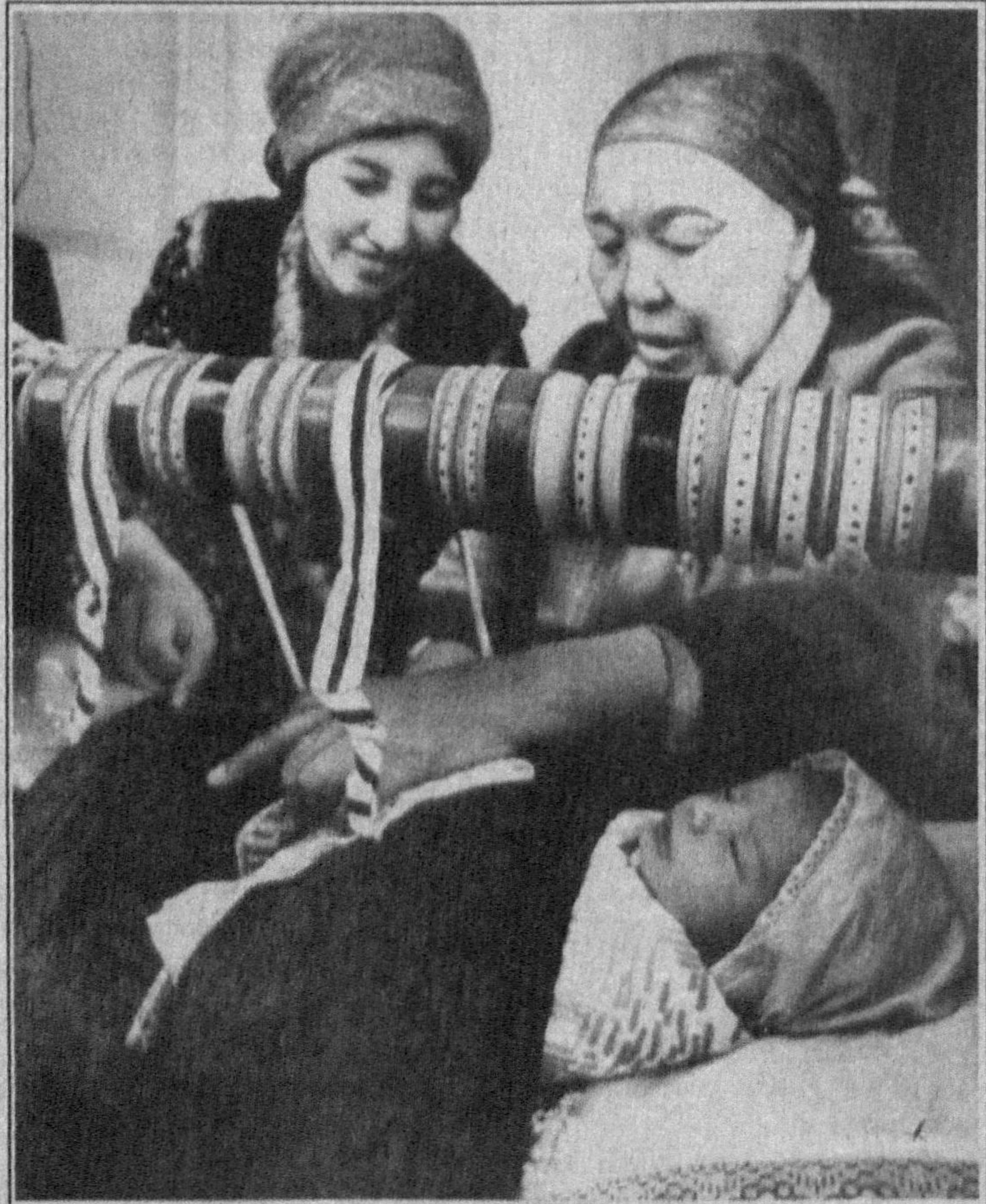
Кулоқ беринг: бутун борлиқ Чунки она алла айтар — Айланмоқда чаманга. Бешикдаги Ватанга.