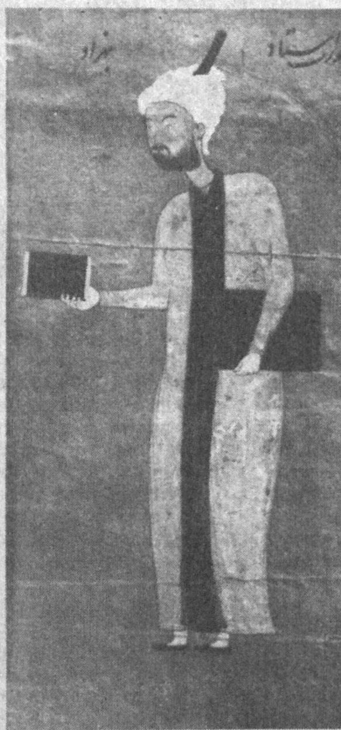
Маълум бўладики, Беҳзод Табризга ўз ихтиёри билан келмаган. Бунинг устига Беҳзоднинг

Айни шу йили, 1522 йилнинг 24 апрелида Шох Исмоилнинг Беҳзодни сарой китобдори этиб тайинлаш ҳақидаги фармони чиқади. Фармон охирида қуйидаги оғохлатиришлар ҳам мавжуд: «Мазкур устод Беҳзод тагин омонат кайфиятини ва диёнат чеҳрасини хотири лавҳи равшан замири саҳифасига нақшласин... иккиозламачилик майлидан сақлансин» (Хондамир).