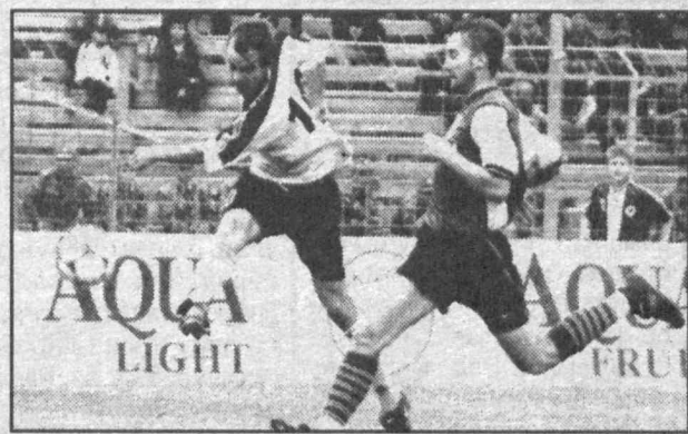
Закончится ли голом игра?