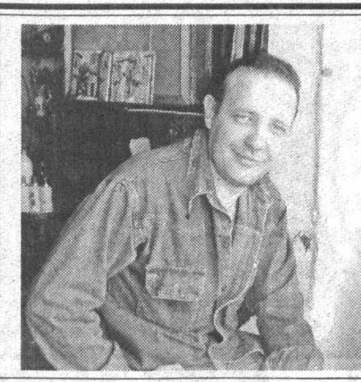
Их наградила Родина