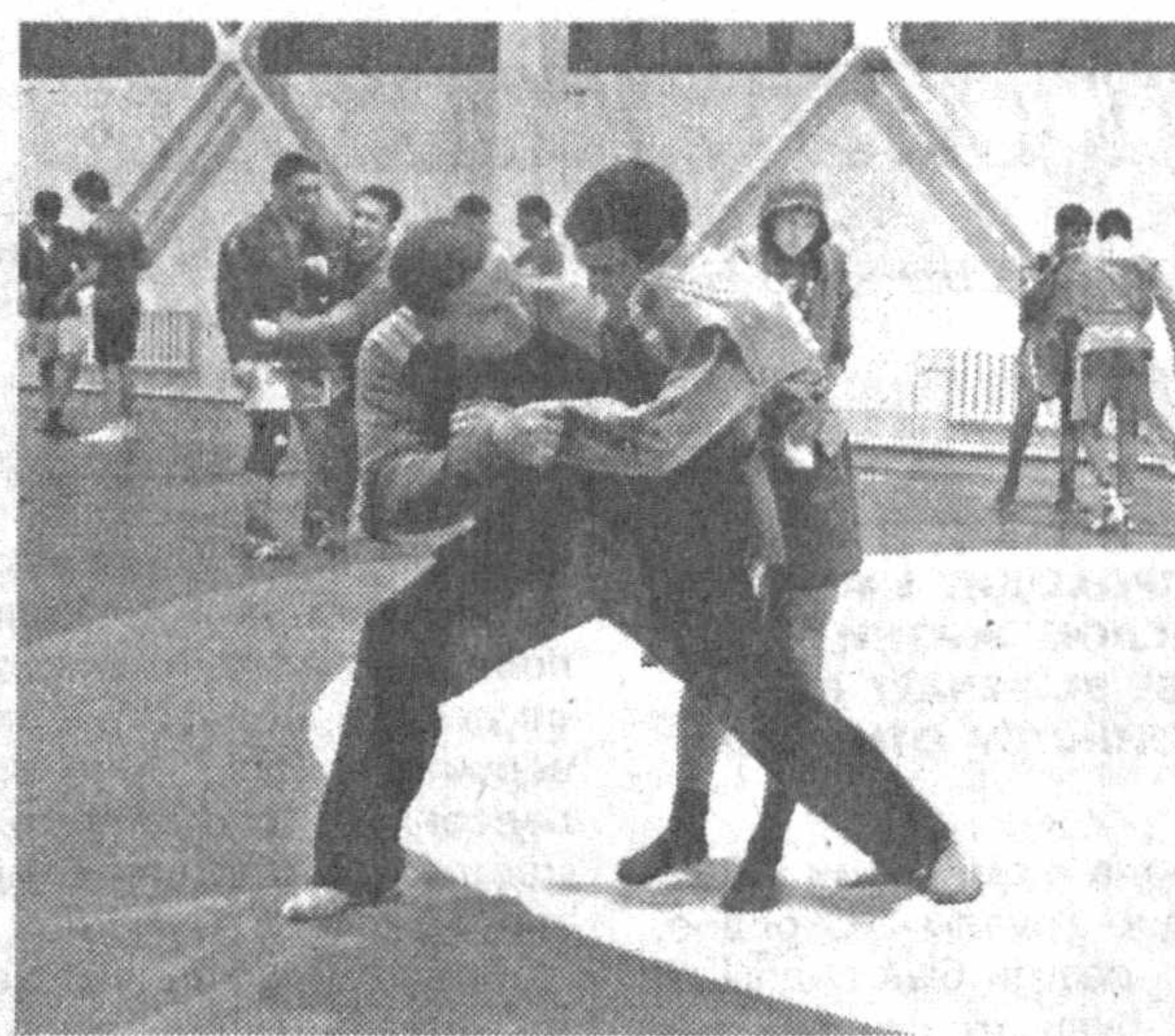
На снимке: тренер объяснит и покажет технику броска или зацепа, расскажет о правилах схватки и приемах ее ведения.