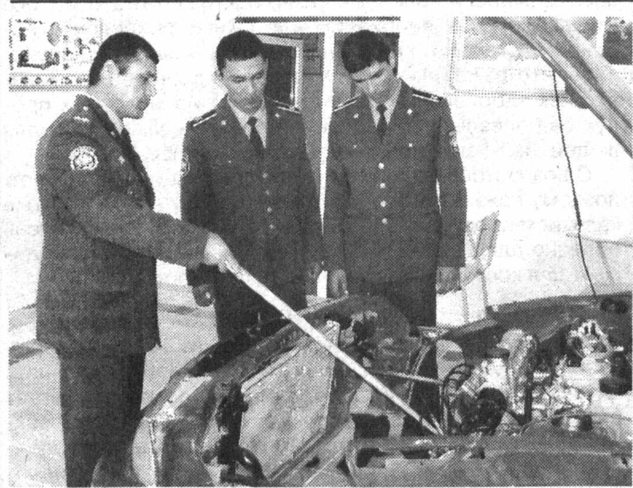
В ОСО «Ватанпарвар»