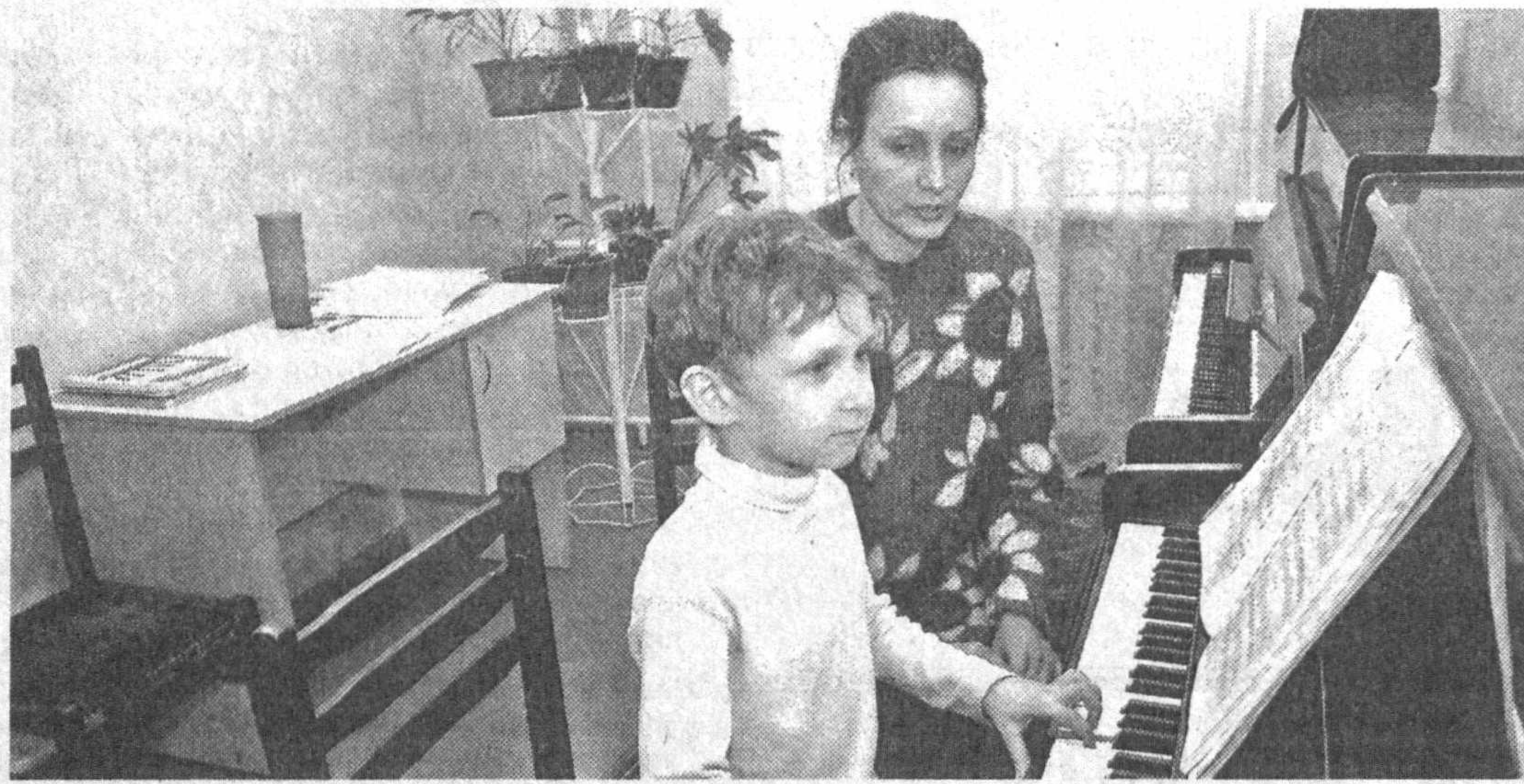
Для столичной детворы созданы все условия для развития своих творческих талантов.