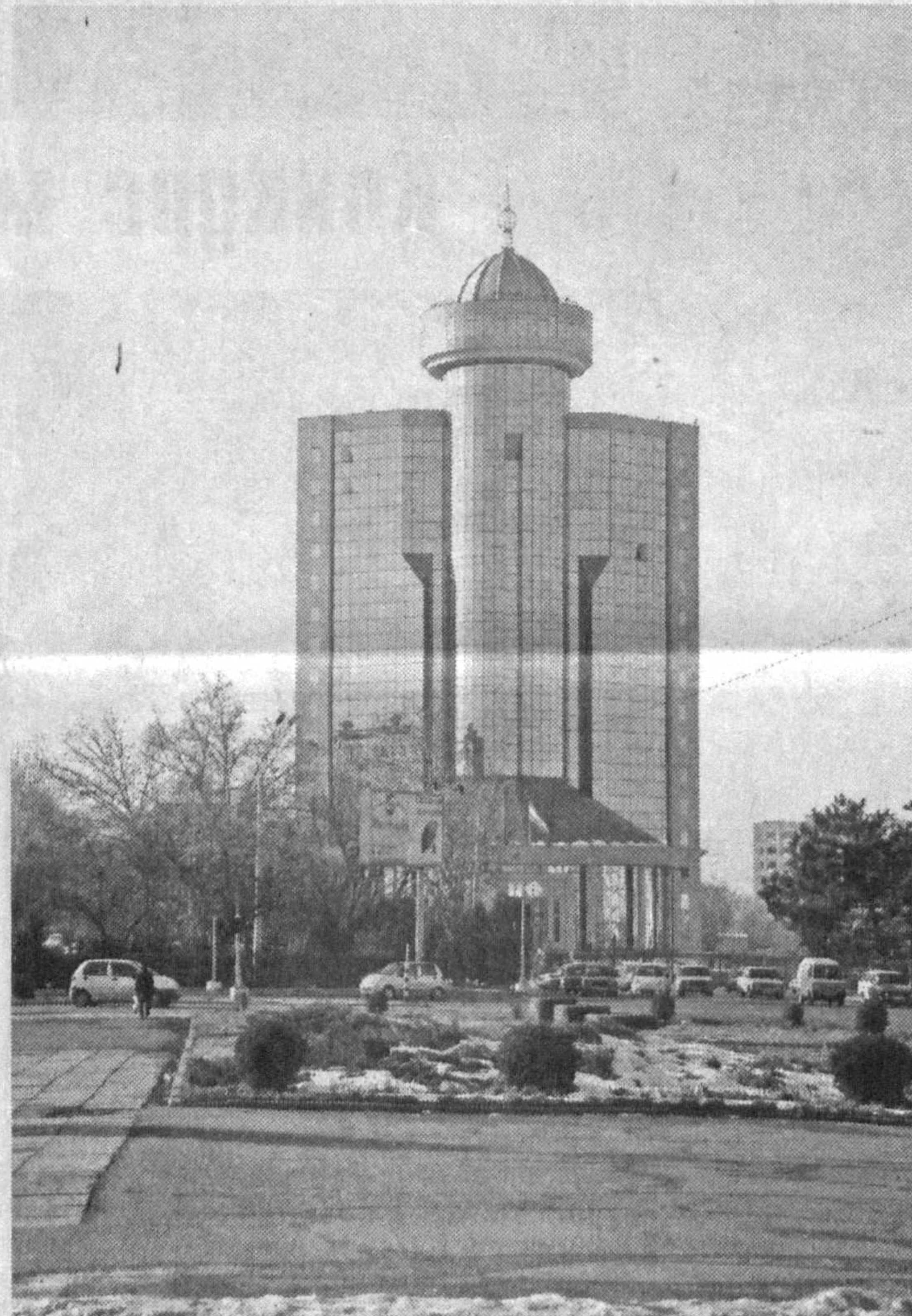
Гузаль САТТОРОВА, корр. УзА.