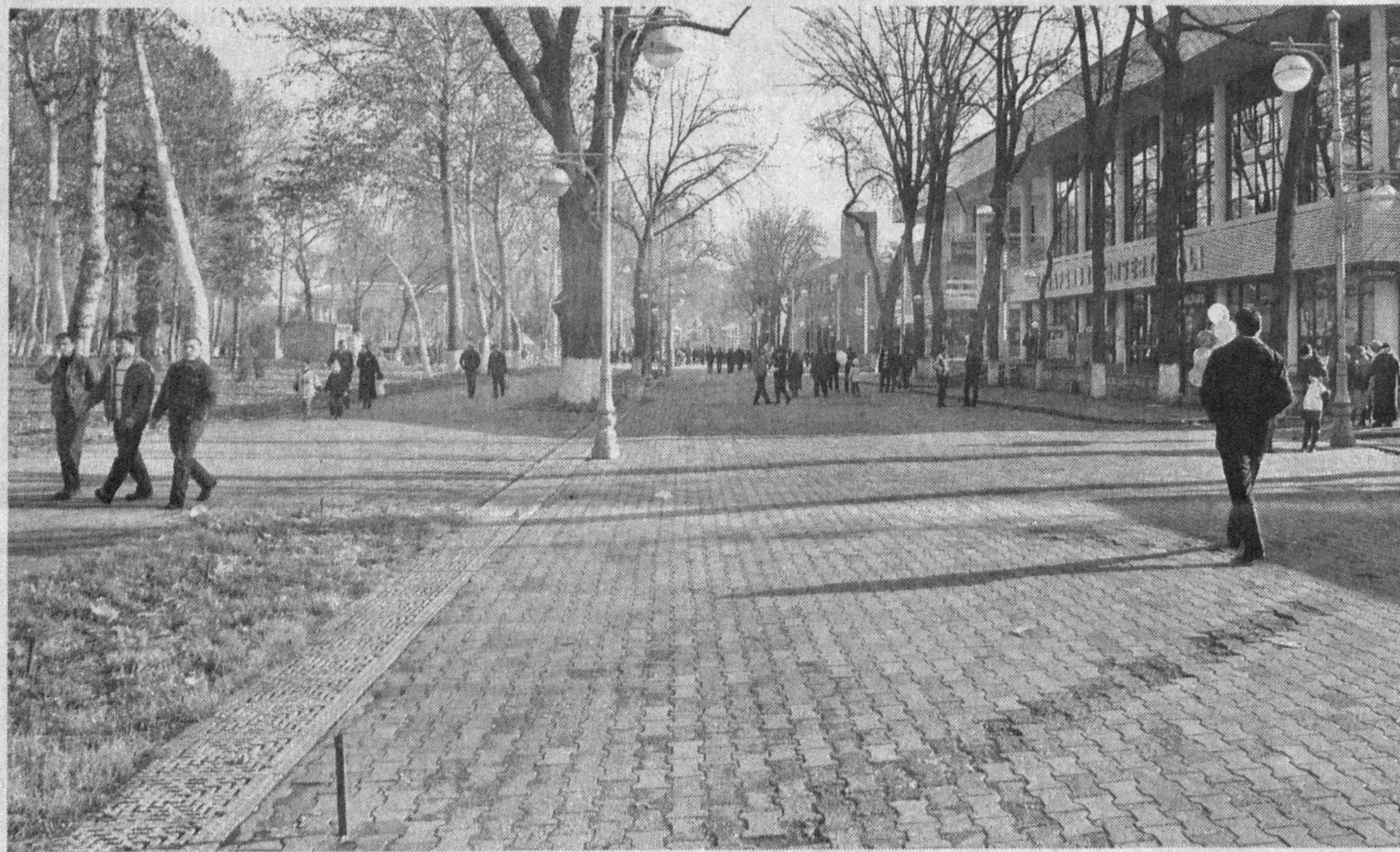
Уже давно Ташкент снискал славу одного из красивейших и ухоженных городов мира.

По материалам Центра «Ижтимоий фикр», подготовила Анна ИВАНОВА, корр. УзА.