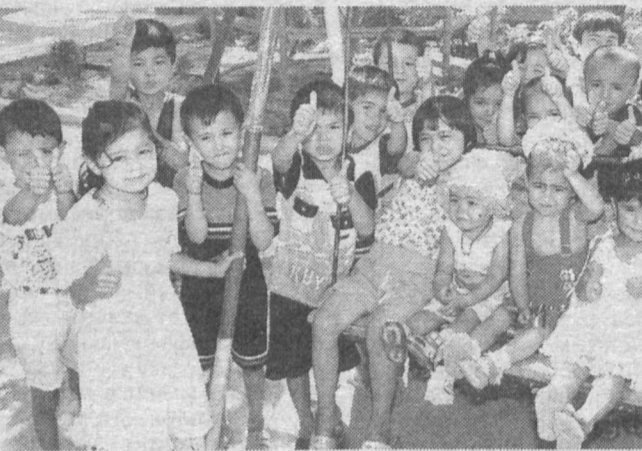
Веселье в разгаре.