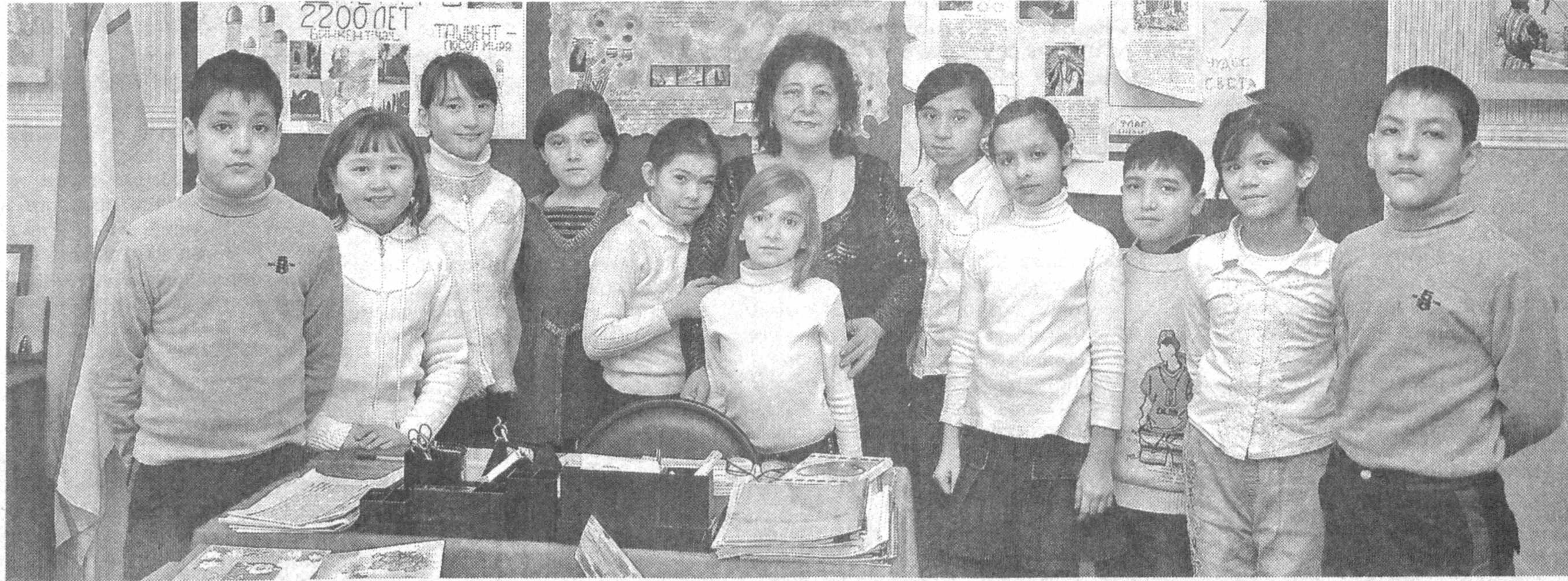
После окончания уроков ребята не спешат покидать школу. Ведь здесь они не только получают знания но и содержательно проводят свой досуг.