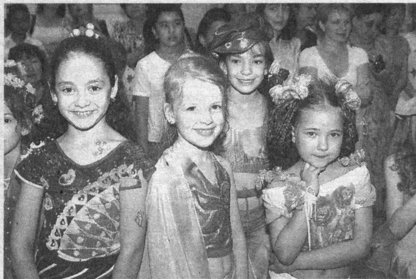
Мгновения детства, наполненные весельем и любовью.

Загадочный механизм был найден у берегов греческого острова Антикиферы. Он может претендовать на звание «первого компьютера», сообщает ИС greese.report.ru. Устройство состояло из 30 шестеренок, выточенных из бронзы, сбоку имелась рукоятка, были 4 циферблата, которые указывали положение планет на небе. Возможно, что таким компьютером пользовались в основном астрономы. С его помощью можно было определять передвижения планет, фазы Луны, время восхода Солнца.