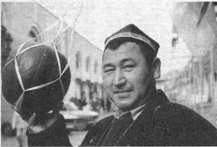
Щедра дарами осени узбекская земля.