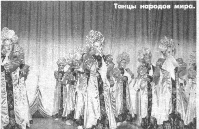
Танцы народов мира.