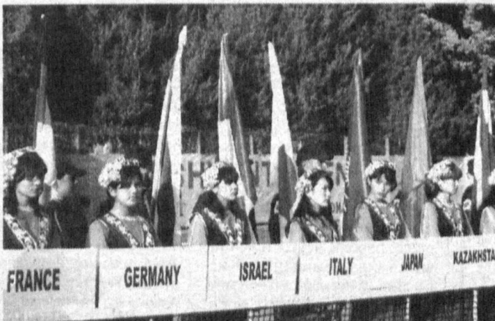
FRANCE GERMANY ISRAEL ITALY JAPAN KAZAKHSTAN