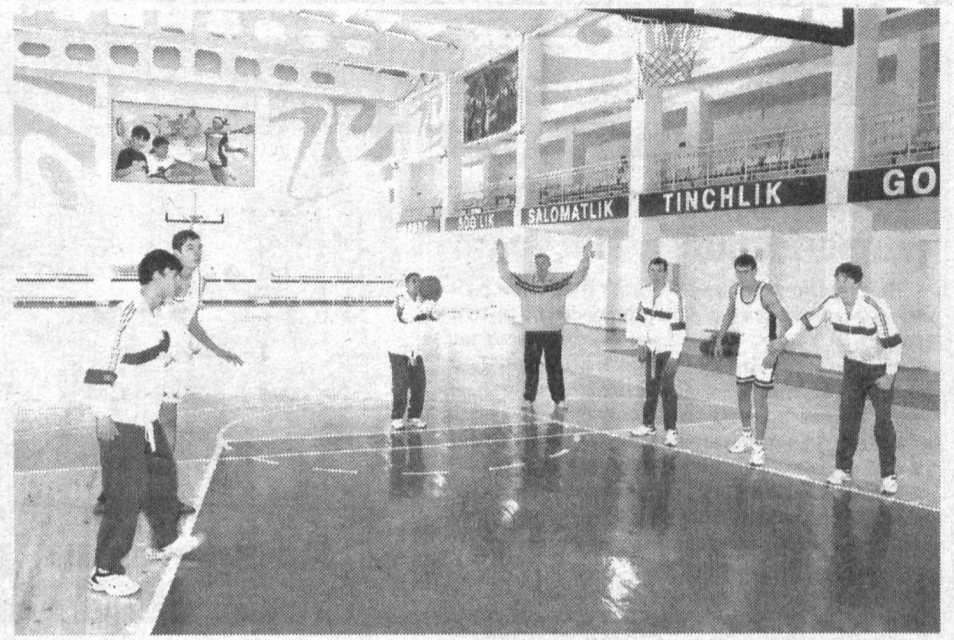
Спорт многообразен. Каждый может выбрать то, что ему ближе — поиграть с мячом в спортивном зале или посидеть за шахматной доской. Было бы желание...