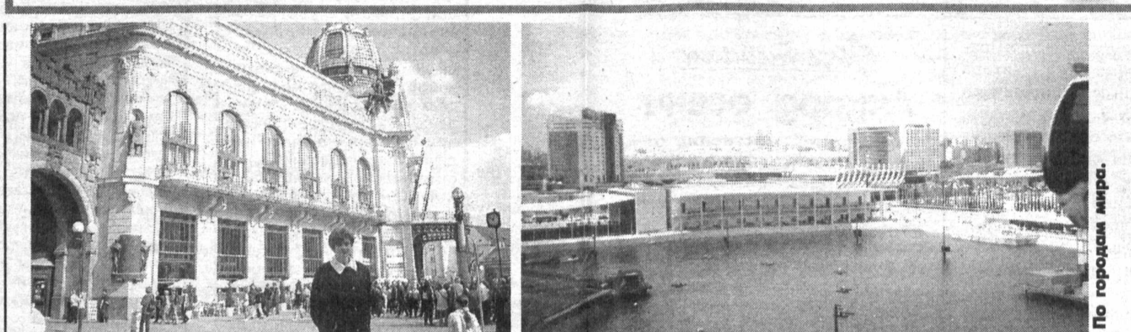
По городам мира.