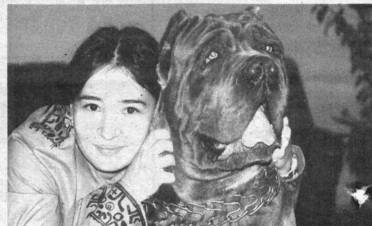
Мы же с тобой друзья!..