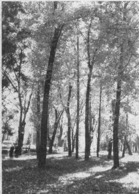
Уж небо осенью дышало...

Родители во многих странах жалуются на то, что их дети редко едят вместе с ними, обычно предпочитают перекусывать на ходу. Хорошим исключением является Франция. Одно из прошедших там исследований на данную тему показало, что 84 процента семей во Франции ужинают вместе. В ходе этого же исследования было обнаружено, что 95 процентов подростков от 12 до 19 лет считают, что в их семье атмосфера во время еды благоприятная. Специалисты подчеркивают важность принятия пищи всей семьей, ведь во время ее приема можно не только поесть, но, что очень важно, пообщаться.