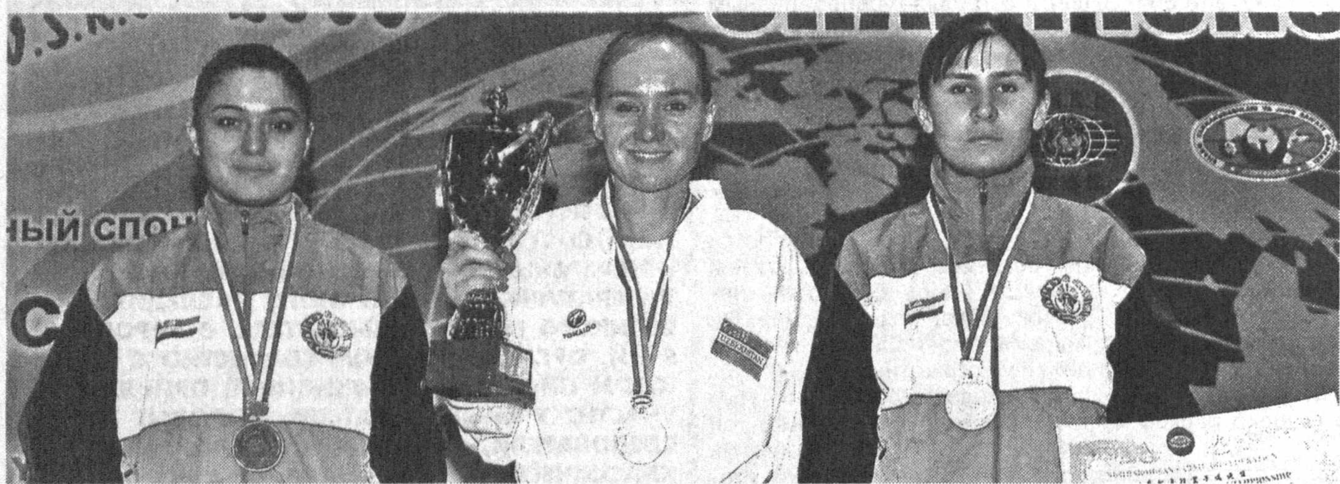
С каждым годом все больше наград в копилке наших спортсменов.