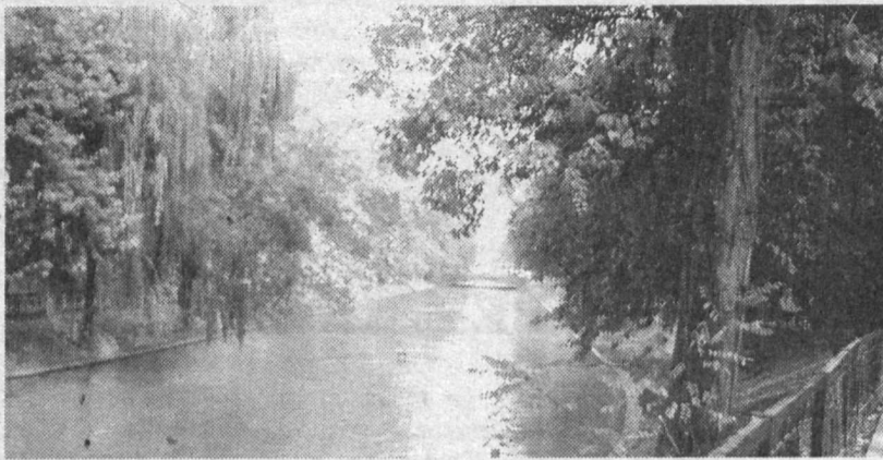
У природы нет плохой погоды.

Кроме людей, нечувствительных к боли, в мире подрастают и другие феномены. Например, в Германии наливаются силой малыш, у которого мускулатура развита вдвое больше, чем у ровесников. Иракский подросток никогда не спит, но зато отдыхает во время общения с потусторонним миром. Годовалый житель Тбилиси весит ни много ни мало 26 кг, и местное телевидение предлагает ему сниматься в рекламе мясомолочной продукции. Но самое большое удивление у специалистов вызывает 10-летний китаец, опровергающий все постулаты медицинской науки: температура его тела — плюс 43°C, хотя кровь по идее должна сворачиваться уже при плюс 42°C.