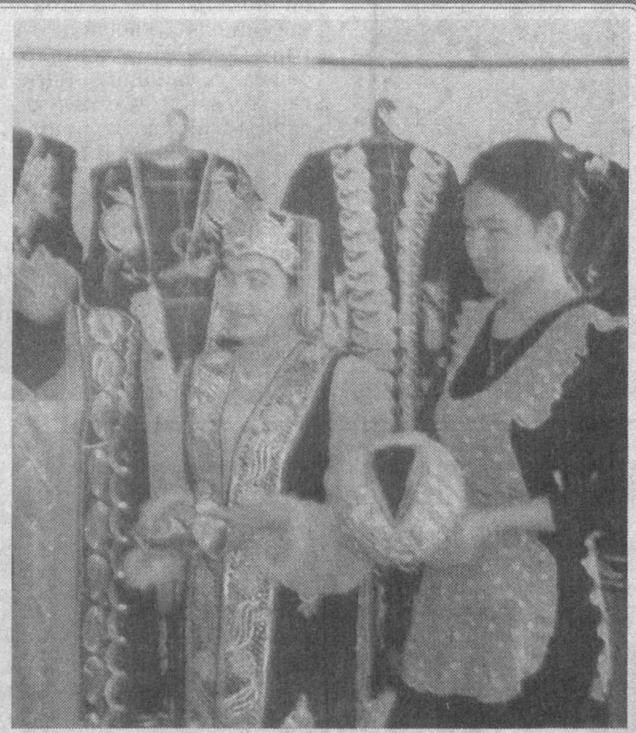
мад қилиб, халқнинг қорига ярабман.