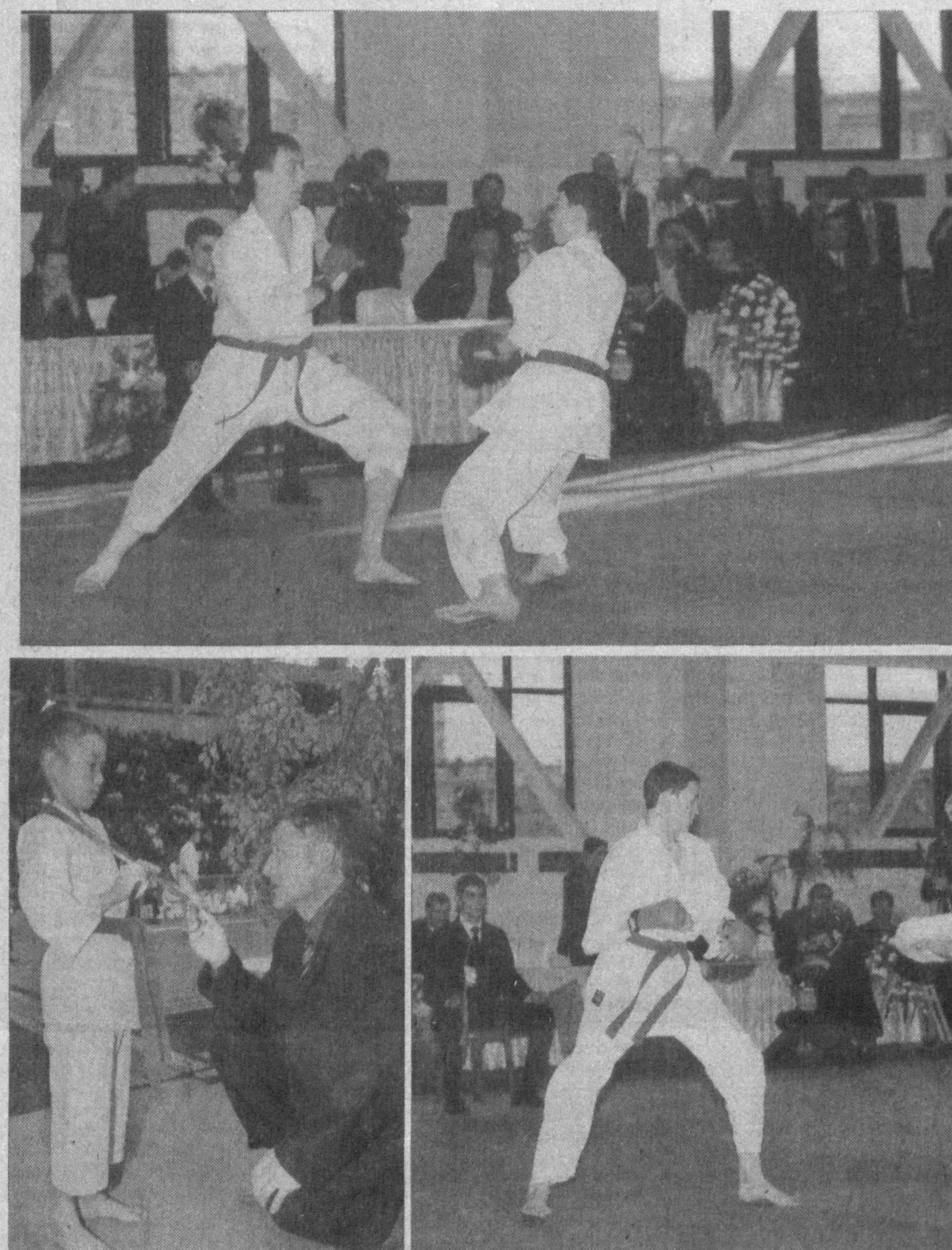
Шу йилнинг 27-29 феврал кунлари пойтахтнинг «ЖАР» спорт мажмуида каратэ бўйича болалар ва ўсмирлар ўртасида IV Ўзбекистон чемпионати бўлиб ўтди. Унда Қорақалпоғистон Республикаси Тошкент шаҳри ва барча вилоятлардан мингдан ортиқ ёшлар иштирок этиди. Катта ва кумитэ бахсларида жамоа ҳисобида Тошкент шаҳри биринчи Қашқадарё вилояти иккинчи ва Наманган вилояти спортчилари учинчи ўринни эгаллашди. Шунингдек, «Ғалабага бўлган иштиёқи учун» соврини ҳам ўз эгалларини топди. Суратларда: мусобақадан лавҳалар.