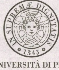
UNIVERSITÀ DI PISA

Посольство Узбекистана в Италии совместно с Национальным офисом программы Европейского союза Erasmus+ в Ташкенте организовало очередную встречу в формате видеоконференции между руководством Министерства высшего и среднего специального образования, Госкомгеодезкадастра и руководством и экспертами Пизанского университета.