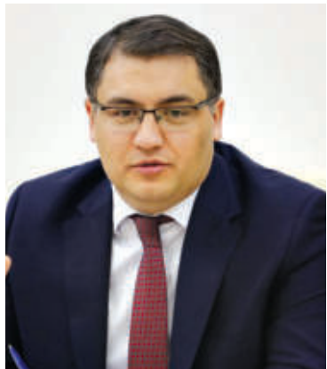
Русланбек ДАВЛАТОВ, Ўзбекистон Республикаси адлия вазири:

Жорий йилнинг 12 октябрь куни Президентимиз раислигида интеллектуал мулк объектларини муҳофаза қилиш тизимини такомиллаштириш чора-тадбирларига бағишлаб ўтказилган йиғилишда соҳадаги қатор муаммо ва камчиликларга эътибор қаратилди. Хусусан, мамлакатимиз бу борада дунё бозоридан узоқлашиб кетгани, илмий институтларимиз инновациялар, тармоқлар эса харидорғир ишланма ва брендлар ярата олмаётгани тилга олинди, соҳага оид қонунчиликни такомиллаштириб, интеллектуал мулк ҳимоясини кучайтириш, ҳар бир идора ва тармоққа илмий ютуқларни олиб кириш масалалари муҳокама қилинди.