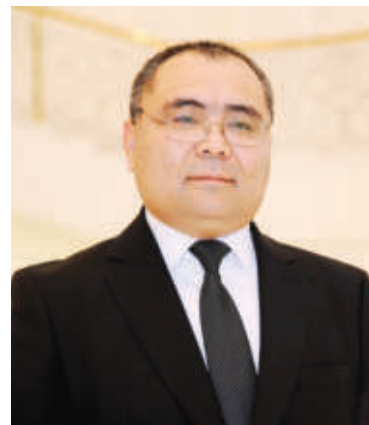
Иброҳим АБДУРАҲМОНОВ, Ўзбекистон Республикаси инновацион ривожланиш вазири:

Йиғилишда соҳадаги ҳар бир масала чўқур таҳлил асосида, танқидий муҳокама қилинди. Айниқса, тизимни такомиллаштириш жараёнида соҳа билан ҳудудни, ҳуқуқий ҳимоя билан яратиш жараёнини боғлаш бўйича жуда катта ишлар қилиниши керак. Бу борада алоҳида 3 йиллик дастур ишлаб чиқилди. Интеллектуал мулк агентлиги томонидан жалб қилинган чет эллик экспертлар ривожланиш стратегиясини ишлаб чиқишга ёрдам берапти. Уйламанки, бугун йиғилишда айтилган муаммоларнинг ечимлари биз ишлаб чиқарадиган янги қонунчилик ҳужжатлари, амалиётдаги ўзгаришлар, соҳада иштирок этувчи иштирокчиларни рағбатлантириш орқали комплекс тарзда тизимни ривожлантиришга хизмат қилади.