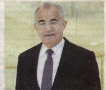
защиты прав, свобод и законных интересов человека и совершенствования молодежной политики.

Участие в работе Форума столь авторитетных международных организаций и представителей зарубежных стран свидетельствует, с одной стороны, о широком международном признании и поддержке инициатив Президента Узбекистана, с другой - об актуальности рассматриваемых вопросов. Они касаются двух важнейших векторов государственной политики Узбекистана -